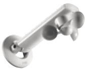
Eolis WireFree io Windsensor für Wintergarten- und Pergolamarkisen