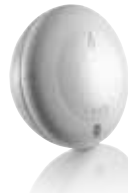
Thermis WireFree io Temperatursensor