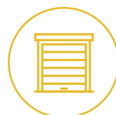
Tore und Türen