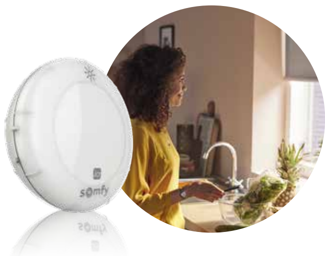
Sunis WireFree II io Sonnensensor