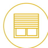
Rund ums Fenster

Somfy bietet Ihnen ein umfassendes Produktsortiment für ein smartes Zuhause ganz nach Ihren Wünschen.