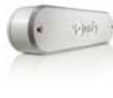
Eolis 3D WireFree io Windsensor für Terrassen- markisen mit Gelenkarmen