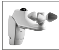
Wind- und Sonnensensor

Zusätzlich können LED-Lichtleisten an den Unterdachmarkisen angebracht werden, so sind Sie unabhängig von Wetter und Lichtverhältnissen.